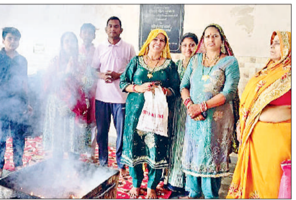
झज्जर। कथा के समापन अवसर पर उपस्थित श्रद्धालु।