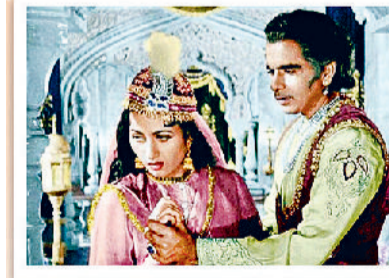
कल्ट क्लासिक फिल्म 'मुगल-ए-आजम'

जो फिल्में कॉमर्शियली सक्सेसफुल हैं, जरूरी नहीं कि वे कालजयी फिल्में भी हों। ऐसे ही यह भी जरूरी नहीं कि सदाबहार कालजयी फिल्मों का बॉक्स-ऑफिस रिकॉर्ड भी अच्छा रहा हो। बॉलीवुड की कुछ क्लासिक और कॉमर्शियली सक्सेसफुल फिल्मों के फंडे पर एक नजर।