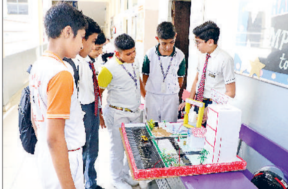
झज्जर। मॉडल्स के बारे में जानकारी लेते हुए विद्यार्थी।

संस्कारम पब्लिक स्कूल खातीवास में नर्सरी से 12वीं कक्षा तक के विद्यार्थियों के लिए परेंट्स-टीचर मीटिंग का आयोजन किया गया। मीटिंग का प्राथमिक उद्देश्य योगात्मक मूल्यांकन-एक के परीक्षा परिणामों को जारी करना रहा। जहां शिक्षकों ने प्रत्येक अभिभावक के साथ व्यक्तिगत रूप से मुलाकात की और विद्यार्थियों की अंक तालिका सौंपते हुए उनके मजबूत पक्षों और सुधार की आवश्यकता