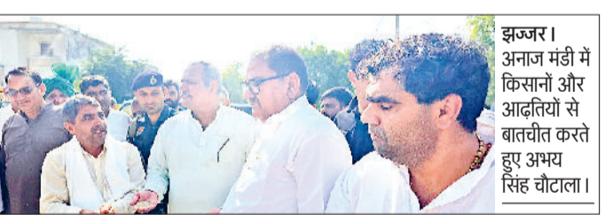
झज्जर। अनाज मंडी में किसानों और आदतियों से बातचीत करते हुए अभय सिंह चौटाला।

इनेलो सुप्रिमो अभय सिंह चौटाला ने शनिवार को अनाज मंडी परिसर में धान और बाजरे खरीद का जायजा लिया। उन्होंने किसानों और आदतियों से मुलाकात की। आदतियों और किसानों ने उन्हें धान व बाजरा खरीद को लेकर आ रही समस्याओं के बारे में अवगत कराया। बाद में पत्रकारों से रूबरू होते हुए उन्होंने कहा कि प्रदेश में कानून व्यवस्था है ही नहीं। प्रदेश में जंगल राज है और अगर प्रदेश में कानून व्यवस्था होती तो अपहरण, डकैती की घटनाएँ नहीं होती और ना ही फिरोतियाँ मांगी जाती।