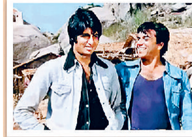
ब्लॉकबस्टर सुपरहिट फिल्म 'शोले'