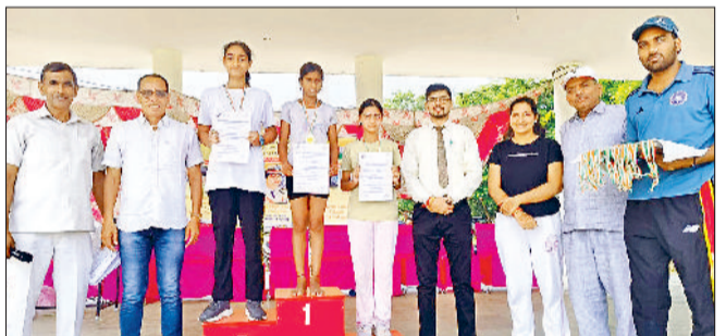
झज्जर। विजेता खिलाड़ियों को सम्मानित करते हुए अतिथि।