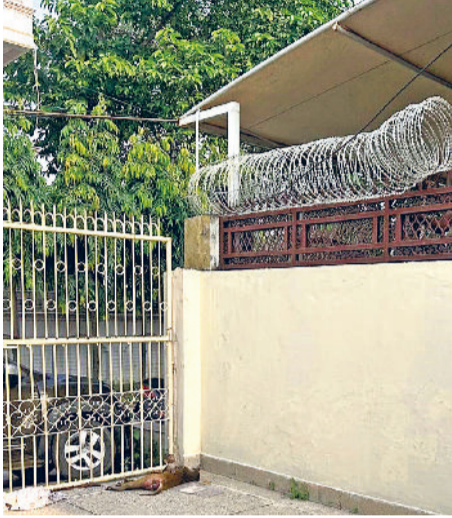
बहादुरगढ़। कंटीली तारों से करंट लगने के बाद फर्श पर गिरा बंदर का शव।