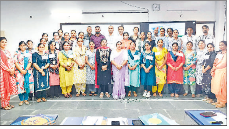
झज्जर। कार्यक्रम में उपस्थित शिक्षक।