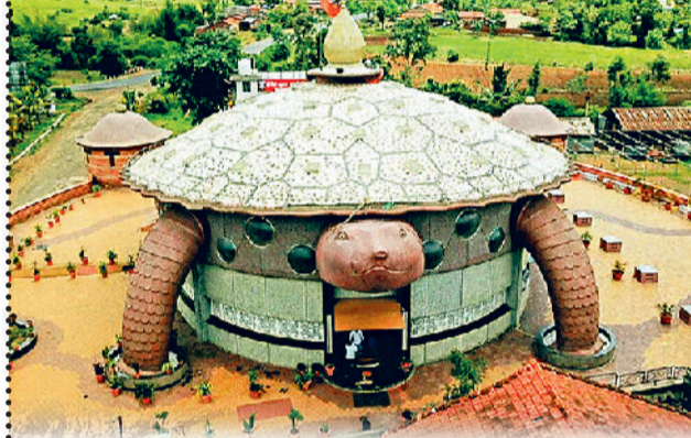
आपने देा में विभिन्न आकार और आकृतियों के बेशुमार मंदिर स्थित हैं। इन्हीं में से एक कछुए की आकृति वाला अनूठा मंदिर महाराष्ट्र के कोल्हापुर में स्थित है। इस मंदिर की विशेषताओं और इससे जुड़ी निर्माण कथा के बारे में जानिए।

साथ जुड़ जाती हैं। ऐसी फिल्में जो समाज में गहराई से जुड़ती हैं, महत्वपूर्ण सामाजिक बदलावों को प्रेरित करती हैं या मानवीय अनुभव की नई व्याख्या प्रस्तुत करती हैं। ऐसी कई फिल्में हैं, जिन्होंने बॉक्स ऑफिस पर करोड़ों कमाए, लेकिन कुछ सालों बाद उन्हें भुला दिया गया है, क्योंकि वे किसी विशेष समय की उपज थीं। दूसरी और ऐसी फिल्में भी हैं, जिन्होंने रिलीज के समय बड़ी कमाई नहीं की, लेकिन अपनी कलात्मक गुणवत्ता, कहानी और स्थायी विषयों वाले कथानक की वजह से आज भी याद की जाती हैं और देखी जाती हैं। कुछ कालजयी हिंदी फिल्में: बॉलीवुड की कुछ फिल्में ऐसी हैं, जो अपने रिलीज के दशकों बाद भी अपना एक अलग मुकाम रखती हैं। इन फिल्मों को हर दौर में हर पीढ़ी के दर्शकों का प्यार मिला। 'कागज के फूल', 'मदर इंडिया', 'मुगल-ए-आजम', 'बॉबी', 'शोले', 'दीवार', 'उमराव जान' जैसी फिल्में को आज भी दर्शक याद करते हैं। इन फिल्मों की गिनती बॉलीवुड के क्लासिक कल्ट के रूप में होती है। खास बात यह है कि इन फिल्मों ने व्यावसायिक रूप से भी सफलता के झंडे गाड़े थे। कई फिल्में अपने समय में व्यावसायिक रूप से अच्छा प्रदर्शन नहीं कर सकीं, लेकिन बाद में उन्होंने फिल्में को बॉलीवुड की कल्ट क्लासिक का दर्जा मिला। उदाहरण के तौर पे 'मेरा नाम जोकर' और 'सिलसिला' जैसी फिल्में को देखा जा सकता है। ये वे फिल्में हैं, जो सिर्फ मनोरंजन ही नहीं करतीं, बल्कि मानवीय भावनाओं, सामाजिक मुद्दों और मानवीय रिश्तों की गहरी समझ को भी प्रस्तुत करती हैं, जिससे वे हमेशा के लिए कालातीत बन जाती हैं। *