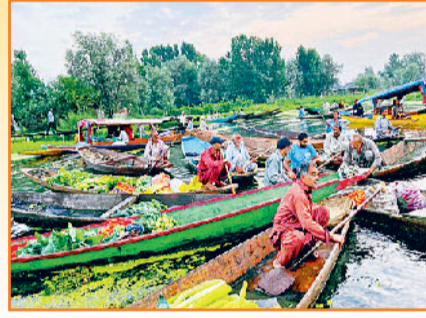
भारत के केंद्र शासित प्रदेश कश्मीर की डल झील पर लगे हुए हैं यह तैरता हुआ डल झील बाजार। डल झील के बीच पानी में थोड़े समय के लिए लगे हुए बाजार कश्मीर घाटी की संस्कृति और सुन्दरता का अद्भुत प्रतीक माना जाता है। यह भारत का इकलौता और दुनिया के चुनिंदा अनोखे बाजारों में एक है, जो पानी के ऊपर लगे हैं। डल झील बाजार का नजारा डल झील की शांत नीली पृष्ठभूमि और पहाड़ों की छाया के बीच कश्मीरी जीवनशैली और प्राकृतिक संसाधनों के साथ निवासियों के गहरे जुड़ाव को भी दर्शाता है। डल झील बाजार में अंजाना सुबह पांच से सात बजे तक चहल-पहल बनी रहती है। यानी इस बाजार से यदि किसी को खनिज खरीदनी है, तो उसे सुबह जल्द ही आना पड़ेगा। स्थानीय विक्रेता लोग शिकरा नाव पर सवार होकर इस बाजार में खुद उगाई सब्जियां लेकर बिक्री के लिए आते हैं। वहीं खरीदार भी अपने शिकरा पर सवार होकर आते हैं और चलते हुए एक नाव से दूसरी नाव पर खरीद-फरोख्त करते हैं।

मछली पकड़ने जैसे कार्य करके अपने उत्पाद बेचने पड़े। तभी यह बाजार अस्तित्व में आया। आज ईमा कीथेल मार्केट दुनिया में एकमात्र ऐसा बाजार है, जो पूरी तरह से महिला विक्रेताओं तकरीबन (6000) द्वारा संचालित किया जाता है। ईमा कीथेल नाम का मणिपुरी भाषा में अर्थ मां का बाजार है, जिसमें प्रायः सभी दुकानदारों को ईमा या मां कह कर संबोधित किया जाता है। यह मुख्यतया तीन खंडों में बंटा हुआ है। जहां घरेलू सामान, फल-सब्जियां, मसाले, विभिन्न प्रकार के जलीय जीव, मणिपुरी पारंपरिक वस्त्र और