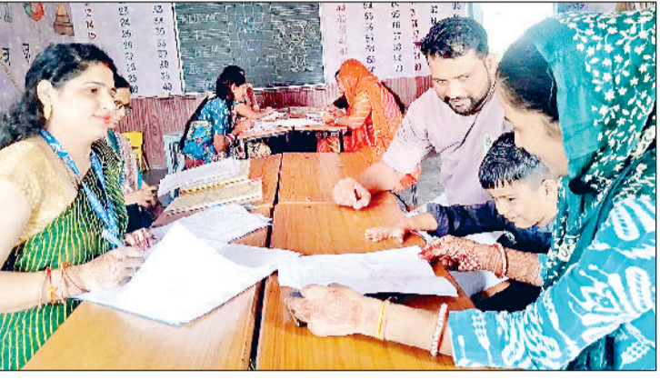
झज्जर। बैठक में उपस्थित शिक्षक एवं अभिभावक।