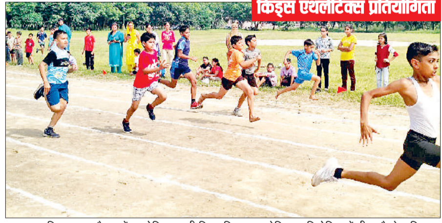
झज्जर। पुलिस लाइन मैदान में आयोजित दूसरी जिला किड्स एथलेटिक्स प्रतियोगिता में तीन सौ से अधिक खिलाड़ियों ने विभिन्न स्पर्धाओं में अपना खेल कोशल दिखाया। इस दौड़ में भागीदारी करते खिलाड़ी।